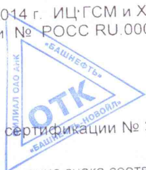
Схема сертификации № 3

КОПИЯ БЕРНА ЗАМ. НАЧАЛЬНИКА ОТК-ЦЗЛ О.А. КУРОВА